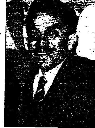
عبد الوهاب السيد صلاح ابو زيد وزير الثقافة والإعلام

يخشى العلماء أن تبيد الحضارة الإنسانية (من الداخل). فقد تصورا مليا مسألة الوراثة الطبيعية وصاروا يمتدنون بأن اضطرابا في كيفية انتقال الحياة بالوراثة ربما ساق البشرية إلى حتفها. وكان العالم النمساوي (مندل) قد وضع قوانين الوراثة سنة ١٨٦٥ وأصبحت نظريته المرجع الأول في كل ما يتعلق بالوراثة الطبيعية. وكان (مندل) قد أجرى تجارب لا تحصى على النباتات وتوغل في البحث عن كيفية تناسلها، وقال علماء الوراثة أن الإنسان له طلبة بليلة التوائين الطبيعية للوراثة. ولاحظ (بوللر) أن الأمراض في معالجة المرضى بالاشعة السينية يولد حالات فوضوية لها، مما يسبب انعكاسات بعيدة وشديدة على النسل. ويقول (موللر) أن الحشرة الحديثة خلقت تفاعلا سلبيا بين الرقي التقني والرقي الوراثي وأضحت تتخلف في الميدان التقني كلما توغلت في الميدان الوراثي. ويعتقد العلماء المعاصرون أن ما يعتبره الإنسان رقا في مستوى المعيشة المادية يرجع به إلى الوراثة: لأنه (يولد) أجبرته الطبيعة.